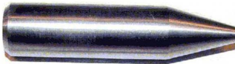
Рис. 3. Сердечник снаряда калибра 30 мм из обедненного урана

Военная промышленность. Для производства снарядов и боеприпасов, предназначенных для танков и крупнокалиберного огнестрельного оружия, используют обедненный уран [9]. Указанный материал обладает достаточно высокой плотностью, поэтому сердечник, изготовленный из него, имеет меньший диаметр по сравнению с сердечником эквивалентной массы, произведенным из другого металла (рис. 3). В результате улучшаются аэродинамические характеристики и пробивная способность снарядов.