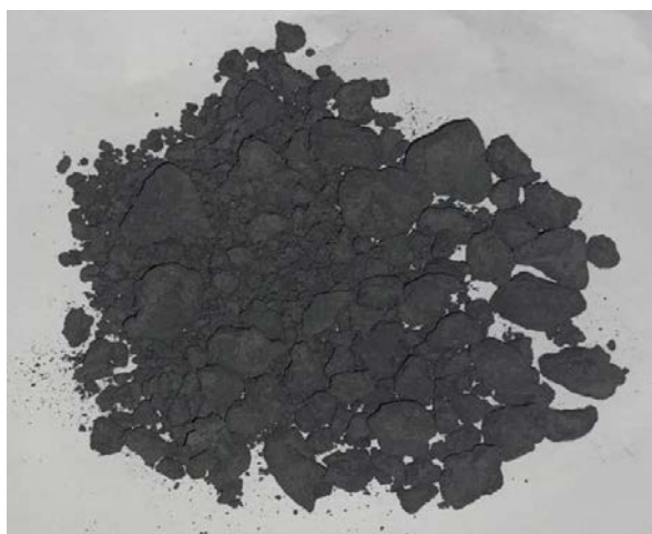
Рис. 4. Результат второго замеса

Результат перемешивания показан на рис. 4.