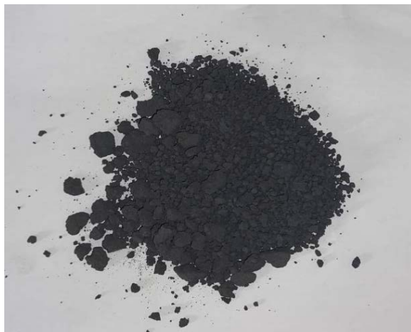
Рис. 3. Результат первого замеса

По виду первого замеса можно заметить, что по структуре шликер получился рассыпчатым, наблюдаются неоднородность и значительное количество фракции из маленьких комочков, по свойствам напоминающих слипшийся металлический порошок. Это может свидетельствовать о неравномерном перемешивании связующей основы с металлическим порошком.