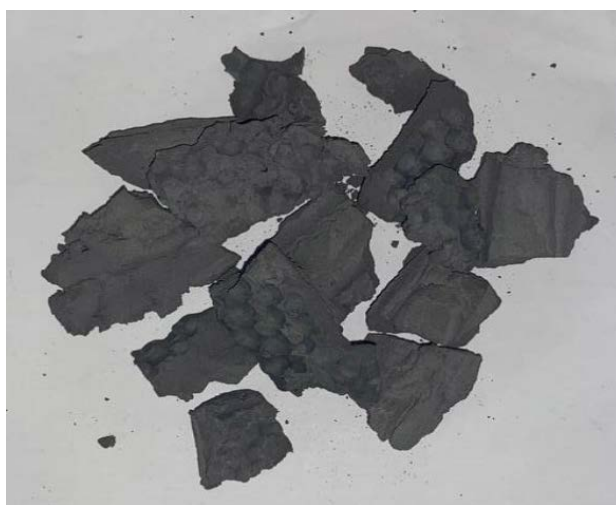
Рис. 5. Результат третьего замеса

Результат перемешивания показан на рис. 5.