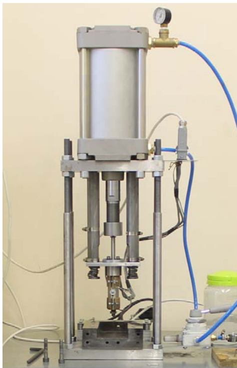
Рис. 6. Лабораторный пресс

Результаты эксперимента приведены в табл. 3.