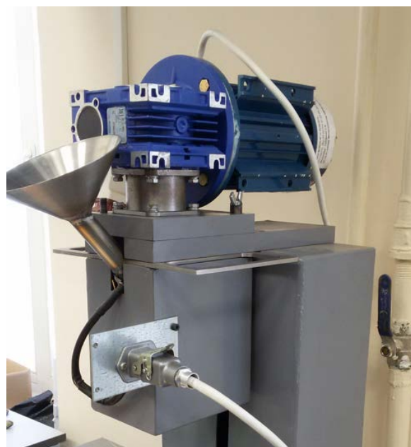
Рис. 2. Лабораторная двухшнековая мешалка

Были рассмотрены следующие режимы приготовления.